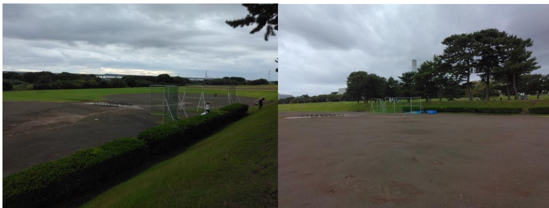
07:13 大神スポーツ広場